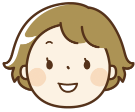
介護歴 8年 28歳 女性

子育て中の介護士ですが、有給もしっかりとれ残業もなくとても働きやすい職場環境です。また、夜勤時には子供を保育室に預ける事ができ、安心して働く事が出来ています。この仕事は自分のスキルアップにも繋がりが役立っています。スタッフ間も助け合い、患者さんを笑顔にできる良い職場です。