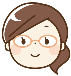
介護歴 6年 25歳 女性

未経験者から介護の仕事に携わりました。仕事を行っていく中で介護の仕事に興味が出て、色々学び介護福祉士の資格を働きながら取得しました。患者さんは病状が安定しなく不安に思ったり、認知症患者さんからの暴言などに戸惑うこともありますが、感謝の言葉を頂いたり、笑顔で退院される姿を見ると得るものもとても大きな事がたくさんあります。