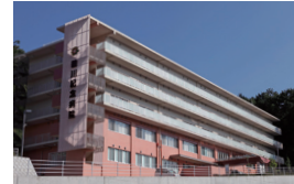
鶴川記念病院と連携しています。向かいに建つグループ病院です。在宅療養支援病院として、ご利用いただけます。

緑豊かな多摩丘陵の一端に位置する鶴川リハビリテーション病院は、高齢者医療・リハビリテーション・在宅医療を中心に、地域密着型の充実した医療サービスをご提供します。 入院中は、患者さんが快適にすごせるよう、スタッフが親身になってリハビリやケアを実践するだけでなく、心のこもったおいしい食事、快適な環境づくりも心がけています。 また、退院後の患者さんが、ご自宅で安心して生活できるよう、在宅ケア体制も整えています。 鶴川リハビリテーション病院は、入院中から退院後までのトータルケアで、患者さんとそのご家族の回復への希望をサポートします。