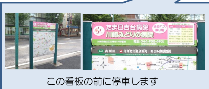
この看板の前に停車します