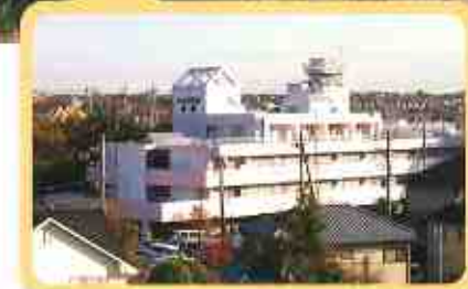
たま日吉台病院本院