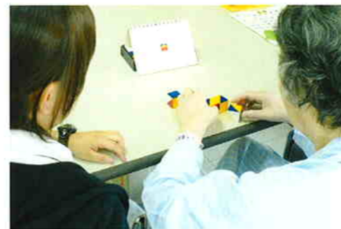
検査を行い個々の患者様に合わせたプログラムをおこないます。

また、日常生活動作(食事・整容・更衣・書字など)を円滑におこなうために道具を必要とされる方には、自助具(動作を容易にするための補助具)の作製も行っています。