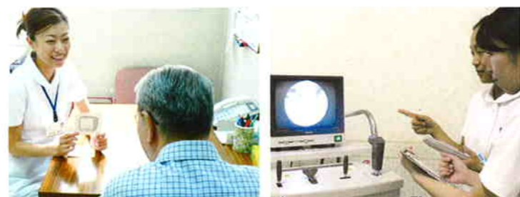
コミュニケーションがうまく取れるように練習します。

言語障害(失語症や構音障害等)や嚥下障害(飲食物を飲み込むことが困難なこと)の方々に対して、検査・訓練をおこなっています。