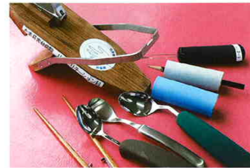
使いやすい自助具(スプーン・はし・爪きりなど)の作製、ご案内をします。