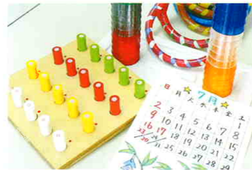
さまざまな道具を使って訓練を行っています。