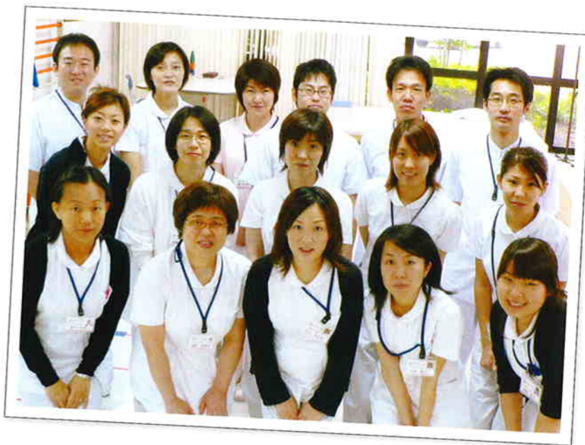
スタッフ一同です!! 4月から新しくスタッフが 加わり、にぎやかになりました。