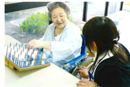
作業を行うことで心身機能の回復をはかります。