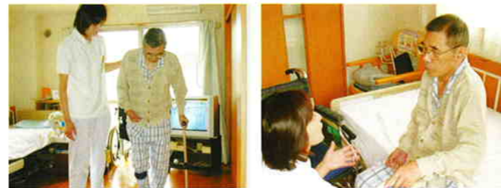
ご自宅の生活環境に合わせたリハビリテーションを行います。

ご自宅での機能訓練や、スムーズで快適な生活が送れるための環境整備、移動方法などのアドバイスをさせていただきます。ご希望の方は、担当ケアマネージャーまでお問い合わせください。