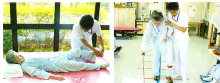
動かしにくくなった身体をさまざまな運動をとおして改善をはかります。

歩行訓練や筋力トレーニングなどの機能回復訓練、寝返り・起き上がり・移動動作などの日常生活動作訓練を中心におこなっています。