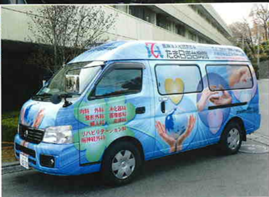
送迎車輛を入れ替えました 以前よりわかりにくいとご指摘いただいていた、送迎車輛の入れ替えを行いました。一目でわかるようになったと思います。

「ひだまり」もおかげ様で二年目を迎えました。企画も新たに、今年度もスタッフ一同皆様に愛される広報紙をお届け致します。これからもご期待ください。