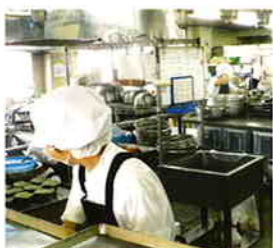
ここで食事を作ります。

こんにちは！ 当院の栄養科および厨房は4階に位置しており、4名の管理栄養士が在籍しています。主に入院患者様、職員、保育室への食事の提供を行っており、食材管理や調理・洗浄などは委託しています。食べることを治療の一環と考え、患者様に少しでも喜んでいただけるよう、季節や行事を取り入れた献立や、病棟訪問、嗜好調査などを行っています。