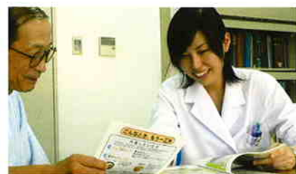
食事内容や献立などご相談ください。

入院生活の中で、食事が楽しみの時間になっていただけるよう栄養科一同、日々努力してまいります。