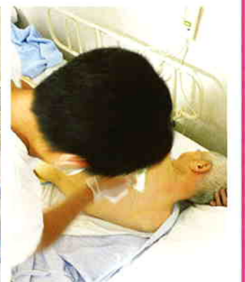
「かゆいところはないですか?」