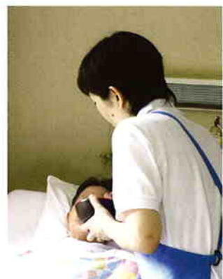
「今日は煮魚ですよ。」

日々の中で、患者様やご家族の方々からの笑顔に支えられながら、職員一同、これからも頑張っていきたいと思っています。ご不明な点、ご要望などございましたらいつでもお気軽にお声をかけてください。今後ともよろしくお願ひ致します。