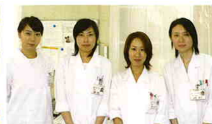
私たちが管理栄養士です。