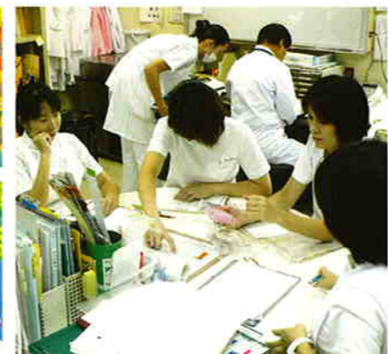
カンファレンス風景