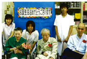
病棟内の誕生会の様子です。

ご利用者様の権利を尊重し、私たちの大先輩のお役にたてるという大切な気持を忘れずに、より良い看護・介護を目指しています。