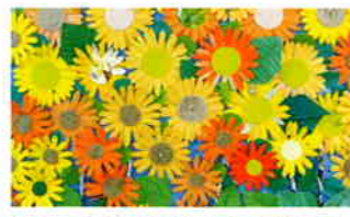
季節感あふれる掲示物です。スタッフ全員の力作です。